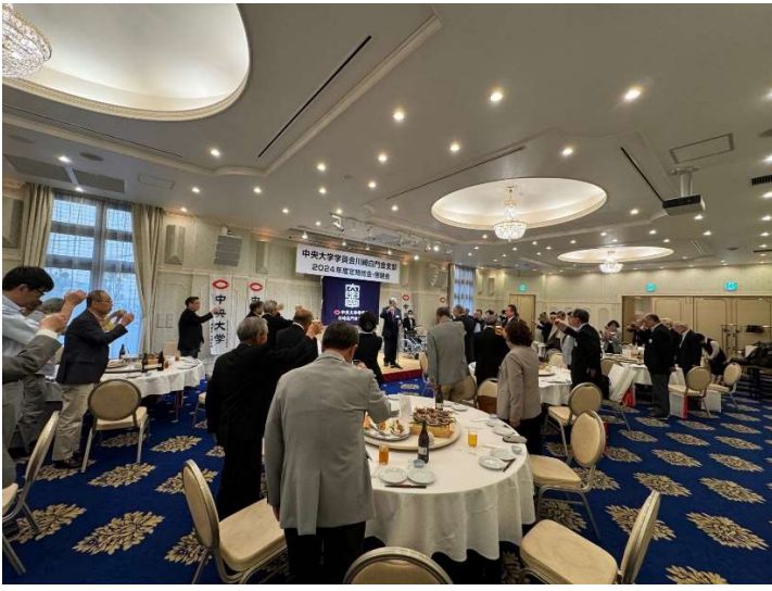
懇親会 参加者での乾杯